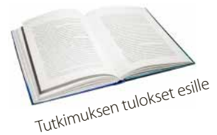
Tutkimuksen tulokset esille