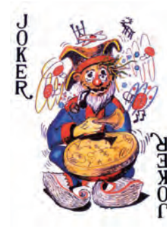
Kuva 7: Pelikortit.