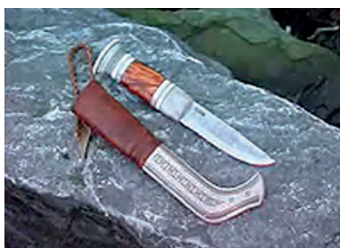
Kuva 1: Puukot.