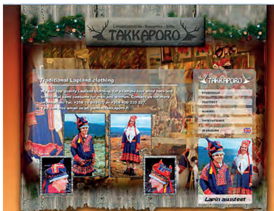
Kuva 5: Lahjatavaraliike.