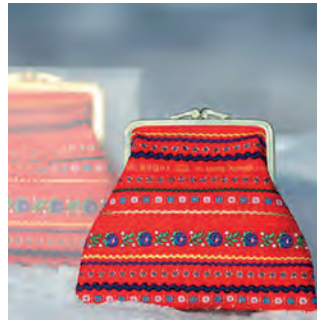
Kuva 12: Ságat-tuotesarjan kukkaro.