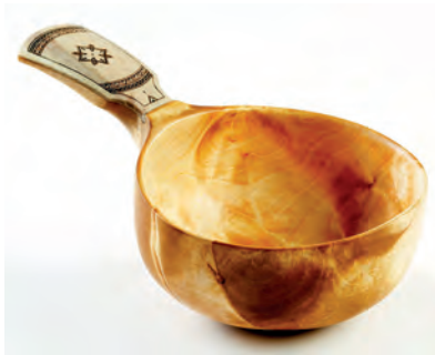
Kuva 11: Kuksa.