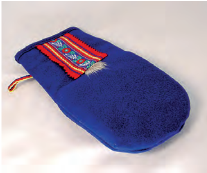
Kuva 6: Patakintas.