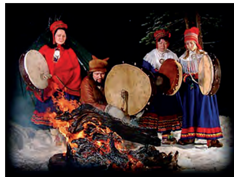
Kuva 10: Lapin shamaani.