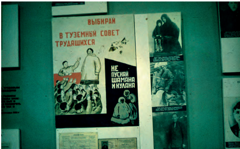
Kuva 13: Vaalipropaganda.