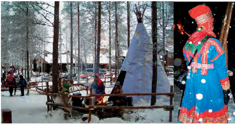
Kuva 8: Napapiiri 2008.