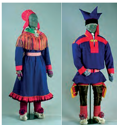
Kuva 3: Utsjoen malli.