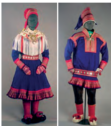
Kuva 2: Enontekiö malli.