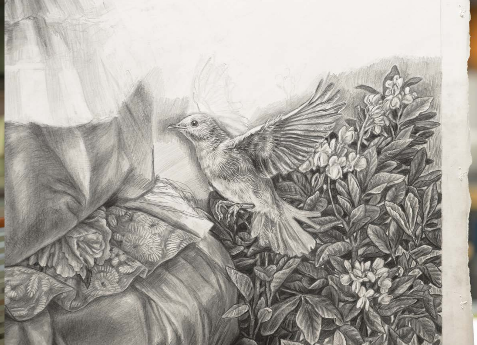
Saaristoa kiinnostaa ihmisissä oleva elämellisyys ja eläimissä oleva inhimillisyys. Yksityiskohta teoksesta Bird lady .

– Silloin oivalsin, että voin purkaa vihaa piirtämiseen.