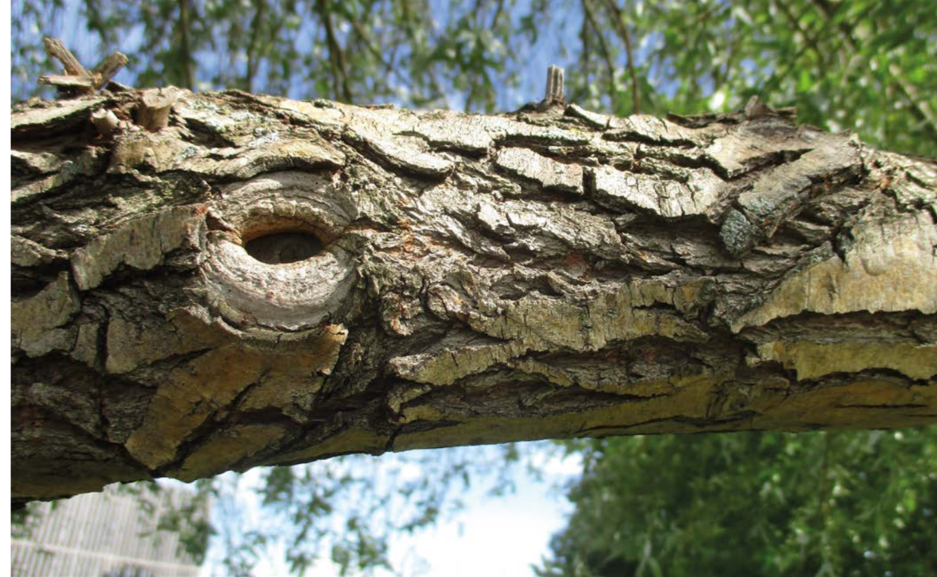
”Suippenevan pajunoksan silmämainen onkalo antaa oksalle lohikäärmeen päätä muistuttavan ilmeen.”

vot, tunnetaan nimellä pareidolia. Joy on kiinnostunut ilmiöstä arktisella alueella, jossa tuttuja muotoja voi nähdä myös lumessa ja jäässä.